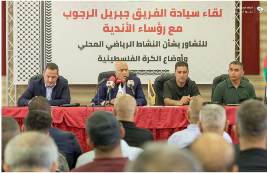
لقاء سيادة الفريق جبريل الرجوب مع رؤساء الأندية للتشاور بشأن النشاط الرياضي المحلي وأوضاع الكرة الفلسطينية

قرر بأن تشارك جميع أندية المحافظات الشمالية بمختلف درجاتها في هذه البطولة، شريطة استيفاء الحد الأدنى من المتطلبات التنظيمية والفنية، على أن يكون الأسبوع الأول من شهر أيلول/سبتمبر موعداً لتطلاق المنافسات. وأوضح الرجوب أن 56 نادياً من قطاع غزة و36 نادياً من لبنان، قررت المشاركة في البطولة الجديدة، بما يعكس وحدة الحركة الرياضية الفلسطينية. وأضاف الرجوب أن الاتحاد سيعتمد، قبل بداية شهر آب المقبل، الآليات النهائية الخاصة باستئناف النشاط الرياضي، بعد استكمال النقاش مع الأندية، مؤكداً أن الهدف هو إشراك جميع الأندية في الوطن والشتات. وأشار إلى أن اتحاد الكرة سيقوم بإنجاز لوحة جدارية أمام مقره تحمل كل أسماء شهداء الحركة الرياضية.