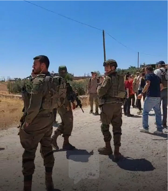
جيش الاحتلال يمنع نشطاء من الاقتراب من الخيمة الاستيطانية في منطقة ابو نجيم - جناته شرق بيت لحم

واختناق، واعتُقل طفل، خلال هجوم قوات الاحتلال والمستوطنين عليهم، ومحاولتهم سرقة قطع أغنام بمسافر يطا جنوب الخليل.