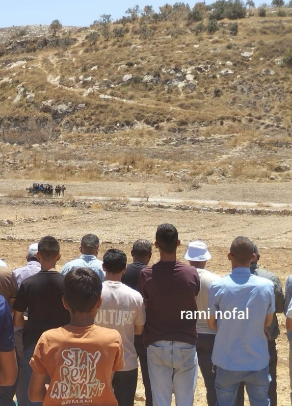
مواطنون يؤدون صلاة الجمعة على أراضيهم شرق إندنا غرب الخليل بعد أن منعهم المستوطنون وجيش الاحتلال من إقامة الصلاة عند مقام النبي صالح الأثري.

كما تجمهر عشرات المستوطنين، على أطراف عدة قرى وبلدات شرق وشمال غرب رام الله والبيرة. وأفادت مصادر أمنية، بأن مستوطنين تواجدوا في أراضي قرية دير نظام، فيما انتشر مستوطنون على الطرقات بين قريتي رمون والطيبة، وبلدة دير دبان.